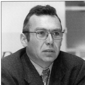
SPÖ-Vorsitzender Dr. Alfred Gusenbauer

Wir schließen mit dem Rat, jeder kehre den Mist vor seiner eigenen Tür weg. ■