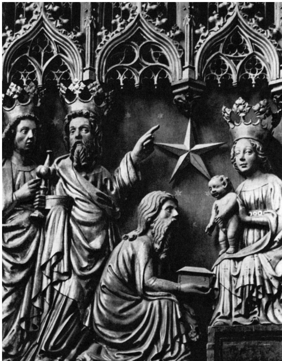
Wien, Stephansdom – Detail aus dem Wr. Neustädter Altar