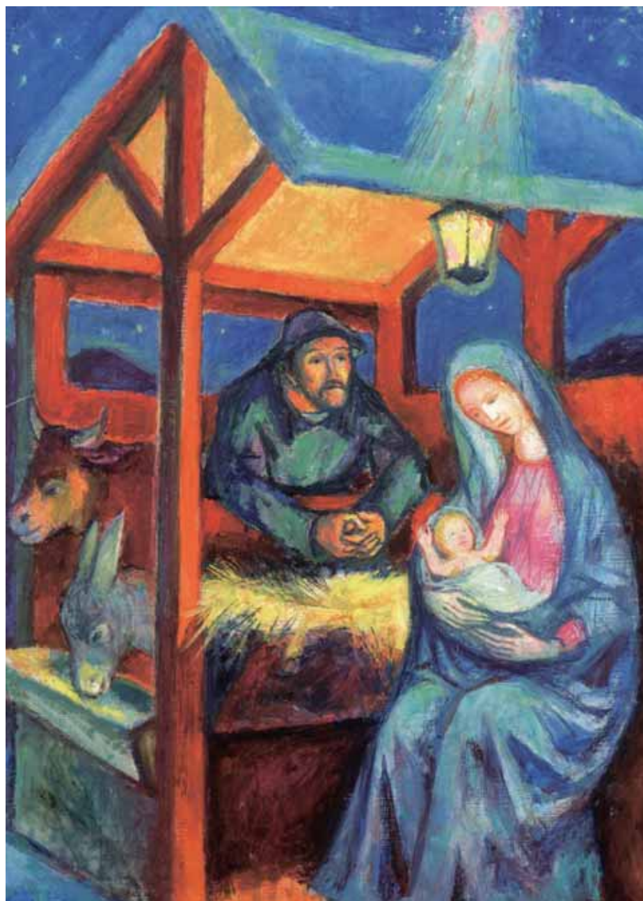
Max Spielmann, 1970, Öl auf Holz; „Die hl. Familie“, Mittelteil des Weihnachtstriptychons

die ÖVP-Kameradschaft der politisch Verfolgten und Bekenner für Österreich sowie „Der Freiheitskämpfer“