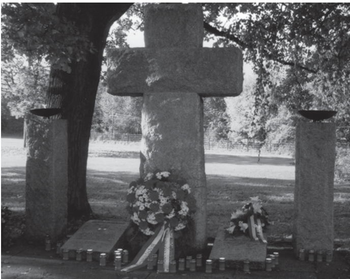
Kreisstadt Dachau, ihres Bürgermeisters sowie im eigenen Namen willkommen heißen. Sie ging in ihren Worten des