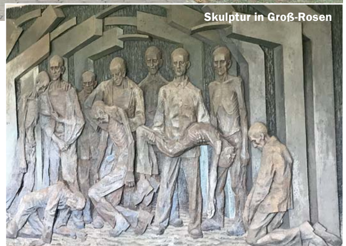
Skulptur in Groß-Rosen

Es ist erschütternd, wenn man diese Lager und Ghettos besucht und es ist unverständlich wie Menschen in derart brutal grausamer Weise gegen ihre Mitmenschen vorge-