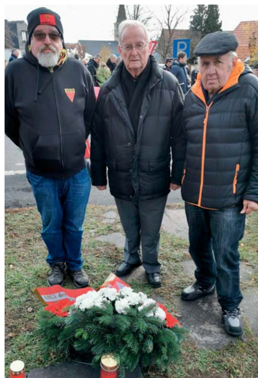
Vertreter der NS-Opferverbände