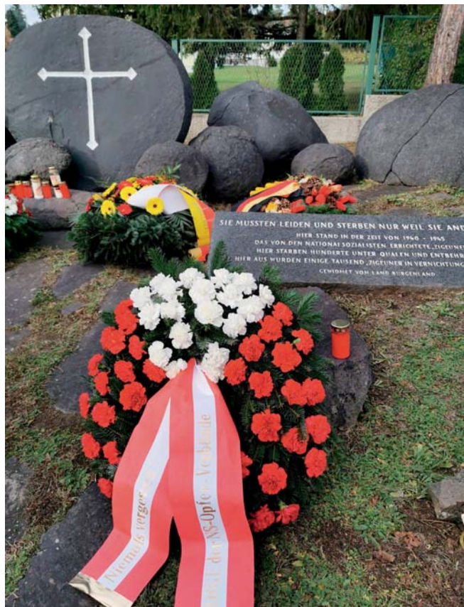
Lackenbach als „Ort der Mahnung“