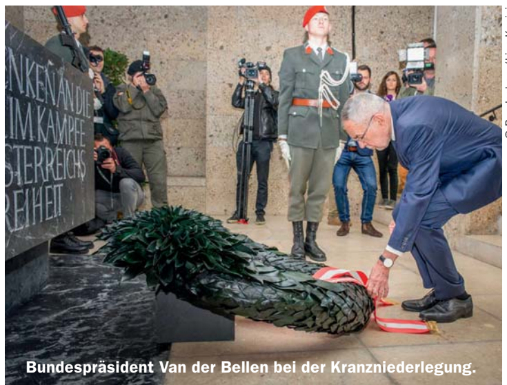
Meldung an den Bundespräsidenten zum Beginn der Kranzniederlegungen.