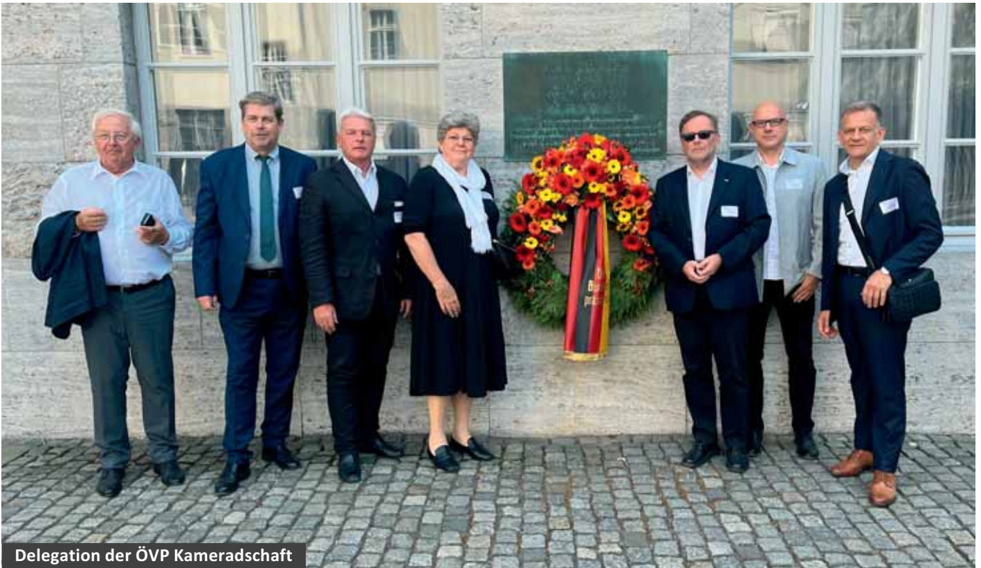
Delegation der ÖVP Kameradschaft

tärs beteiligt gewesen. Tatsächlich hat diesen Umsturzversuch ein Netzwerk getragen, zu dem Offiziere genauso gehörten wie Zivilisten, aus ganz unterschiedlichen gesellschaftlichen Gruppen, Berufen und Weltanschauungen, von Kommunisten und Sozialdemokraten, über Gewerkschafter bis zu Konservativen. Deshalb ist es uns auch ein so großes Anliegen, immer wieder die Breite des Widerstands hervorzuheben und aus Anlass des 20. Juli auch an den gesamten Widerstand gegen das NS-Regime zu erinnern. also auch an Georg Elser und die Geschwister Scholl, den Kreisauer Kreis, die „Rote Kapelle“, das kommunistische Netzwerk um Anton Saefkow, den Widerstand aus der Arbeiterbewegung ebenso wie den bürgerlichen, den christlichen und den militärischen Widerstand und die vielen auch weniger bekannten Männer und Frauen im Widerstand. Ein weiteres Teilstück des erwähnten NS- Narrativs war, dass die „ganz kleine Clique“ nur aus Männern bestand. Deshalb ist es