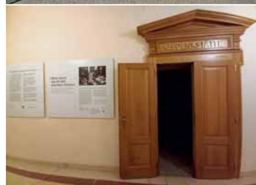
Vorraum der Hinrichtungsstätte