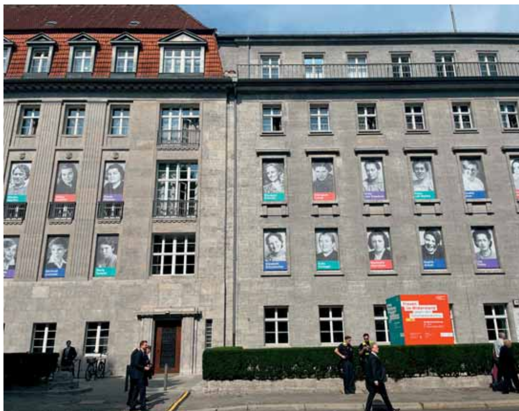
Bendlerblock, 1933–1945 Oberkommando des Heeres, Bendlerstraße 13

Umso lebendiger bleibt daher unsere Verpflichtung, für die Freiheit des Gewissens und die Freiheit der Meinung Andersdenkender einzutreten und die-