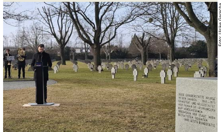
Übergabe des Soldatenfriedhofs von Deutschland an Österreich

In einer würdigen Zeremonie überreichte der deutsche General Wolfgang Schneiderhan unserem Innenminister das Totenbuch. Dieses enthält die Namen aller in Wien bestatteten Soldaten der Wehrmacht. Eine große Abordnung der Wiener Polizei nahm ebenfalls an der Veranstaltung teil! ■ NK