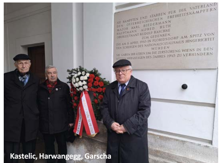
Kastelic, Harwangegg, Garscha